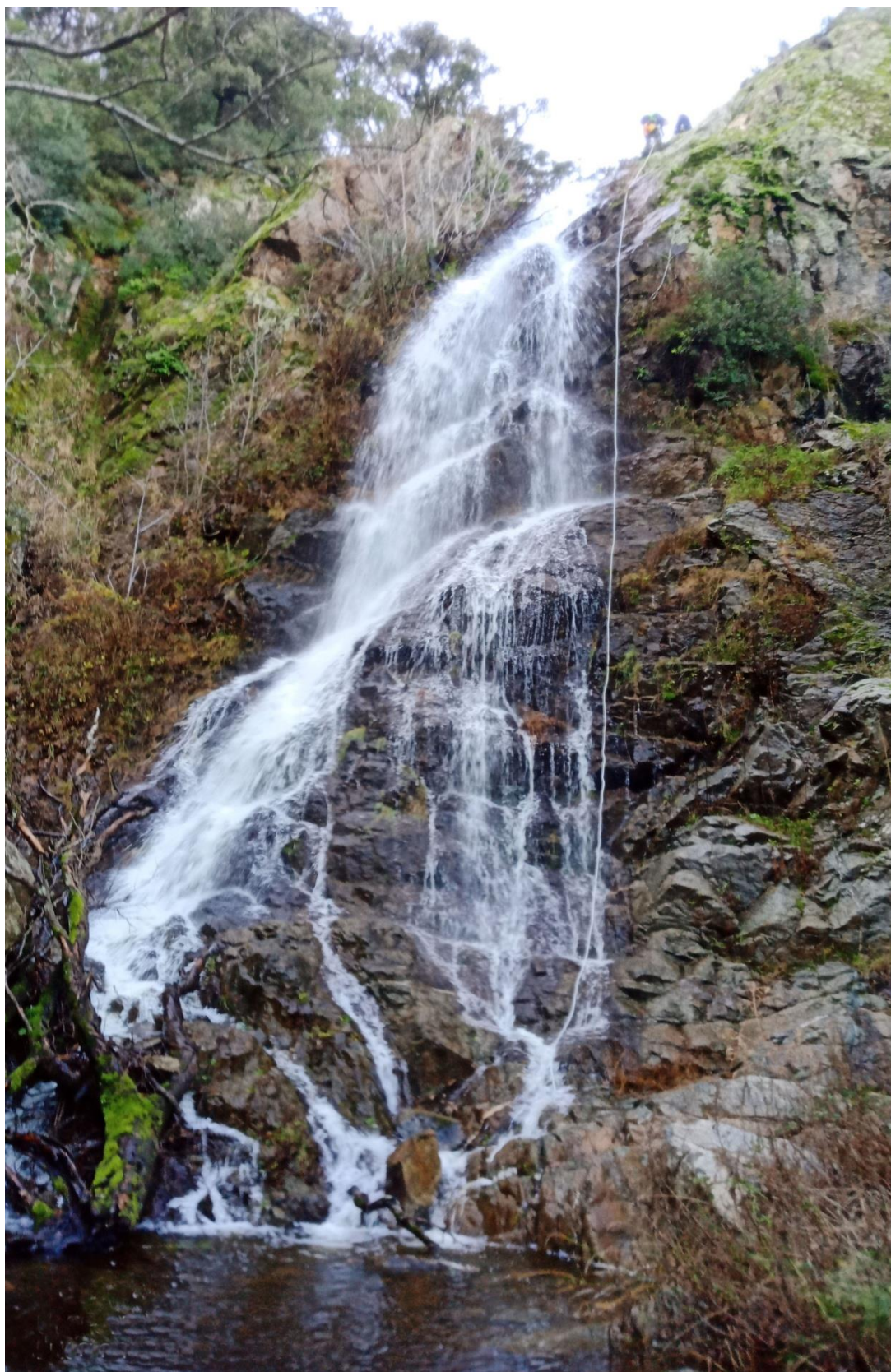
La cascata più importante di ICOARVA 30 MT

ASSOCIAZIONE SPORTIVA DILETTANTISTICA CULTURALE