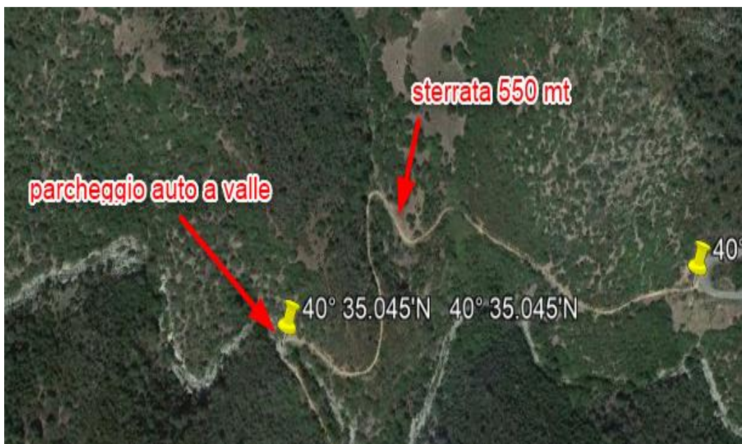
Sterrata che porta al guado ( uscita forra )